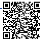
График защиты проектов:

https://sferum.ru/ ?call_link=8QxIFM3y0jpUboXgbBfmXpThwwkmo1VT6cliCqvV88